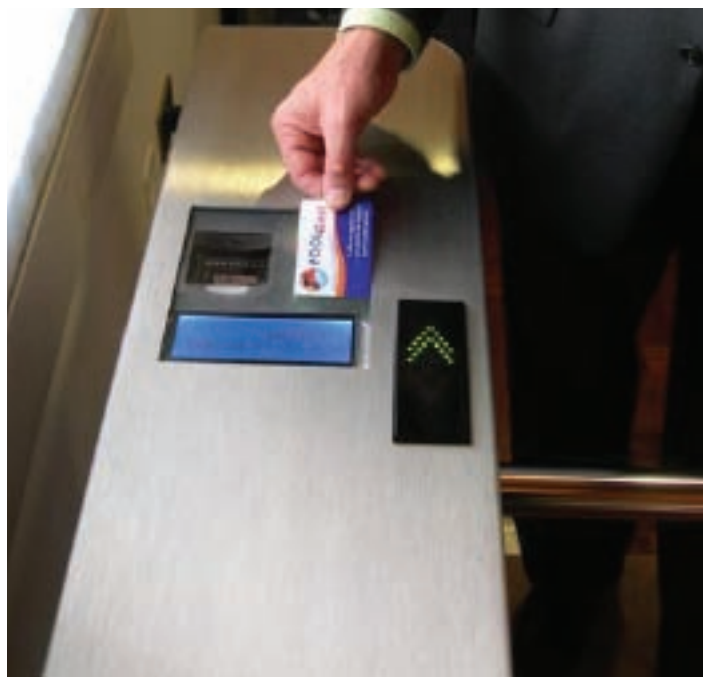
Da obbligo per tutti a misura piena di eccezioni

Occorre una rivoluzione culturale della quale, nei provvedimenti del Ministro, allo stato pare non esservi traccia.