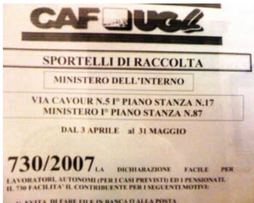
Qualcuno fa un pò come gli pare con i locali ministeriali

ciazioni che abbiano un "rilevante interesse" (ma senza un provvedimento scritto, questo "rilevante interesse" è di difficile comprensione). Questa singolare posizione è stata confermata bellamente anche in sede di giudizio, infatti la I sez. del TAR Lazio, nel motivare l'inammissibilità del ricorso proposto dalla Federazione INTESA riguardo l'accesso agli atti relativi all'assegnazione di locali a soggetti sindacali e non, scrive: "l'Amministrazione ha chiaramente precisato che tale attività viene eser-