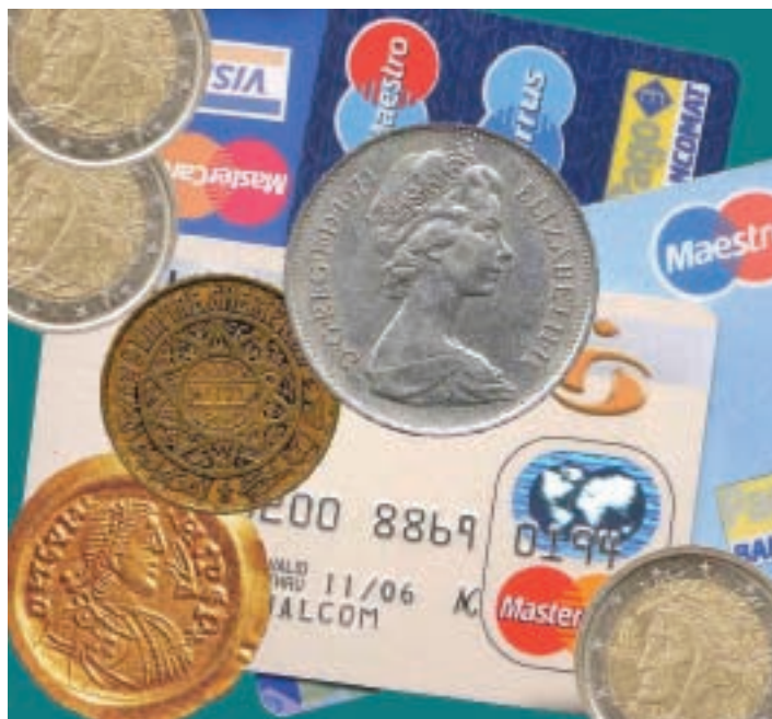
Il riconoscimento del valore della moneta è solo una questione di fiducia

della moneta Per farla breve, una banconota da 20 € vale 20 € perché chiunque, accettandola in pagamento, è sicuro che altre persone, alle quali a sua volta sarà ceduta la banconota, riconosceranno che tale banconota vale 20 € e non certo per un suo valore reale o corrispondente alla quantità-oro dei depositi della BCE che, essendo sconosciuti, potrebbero essere anche prossimi allo zero. E arriviamo a noi, alle vicende legate alla crisi economica mondiale che si approssima. Le banche di affari, gli istituti finanziari e le società per azioni, tutti enti privati, non hanno fatto altro che continuare su questa strada. Hanno emesso titoli, come si vogliono denominare, cui hanno dato un "valore fiduciario" legato a presunti crediti vantati o solidità economica, capacità di fatturato